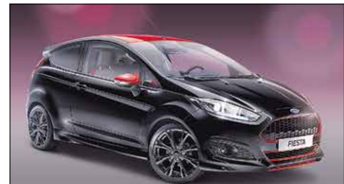
Abbildung zeigt Wunschausstattung gegen Mehrpreis.

Metá • Platzgasse 20 • 89073 Ulm • Tel. 0731-7083424 • www.meta-uhl.de • info@meta-uhl.de