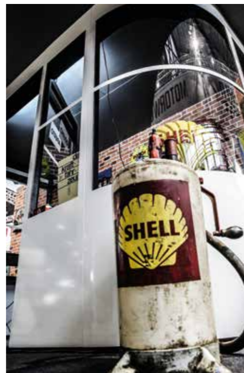
Die Zwei von der Tankstelle

Weitere Informationen unter www.alte-tanke.com